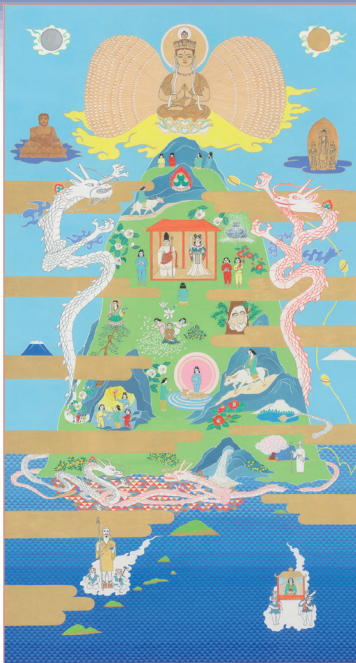
「はじまりは火と水の力巻」