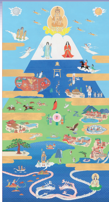
「美しき山を目指す者巻」